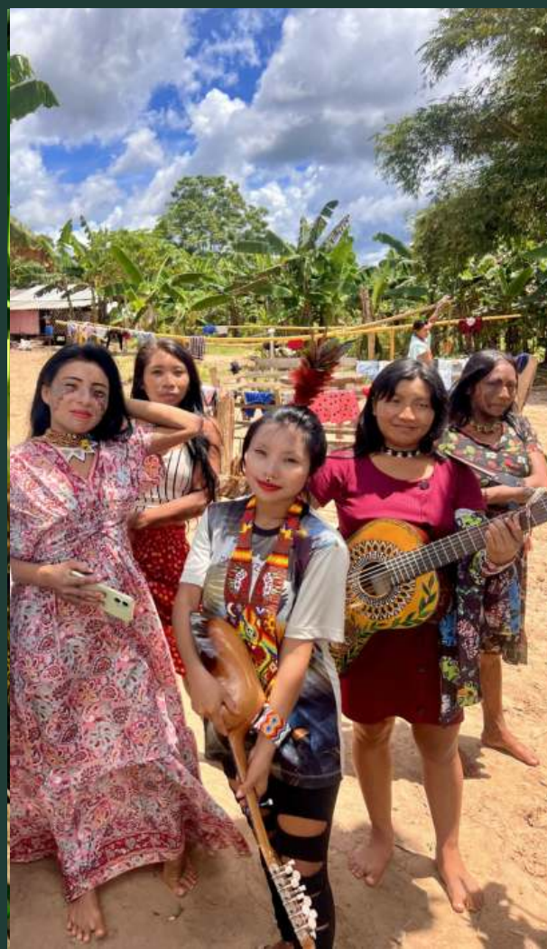
Propojení s kulturou Huni Kuin