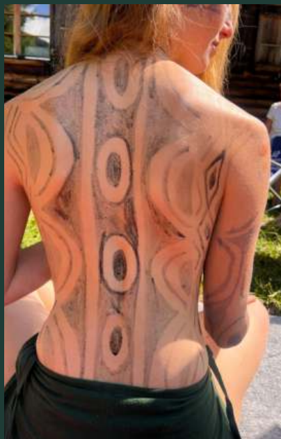
Posvátné malování Kene