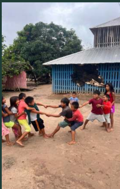
Poznání tradičního života ve vesnici