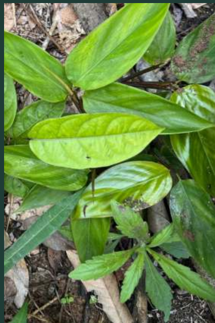
Koupel s bylinami z džungle