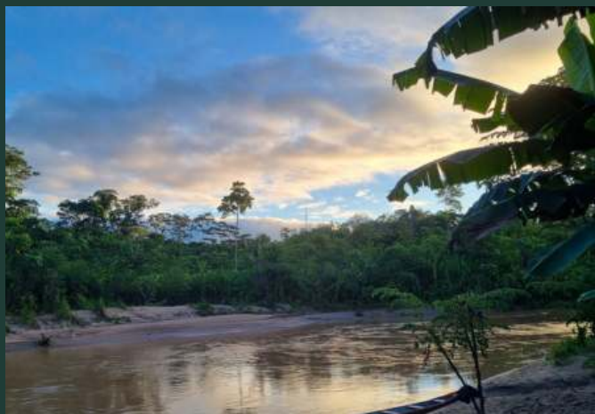
Propojení s přírodou